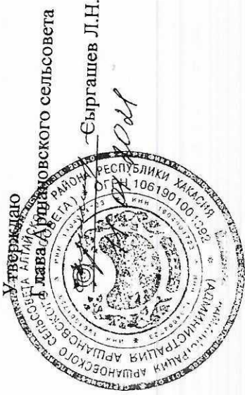
СХЕМА ТЕПЛОВАЯ СЕТЬ с. АРШАНОВО